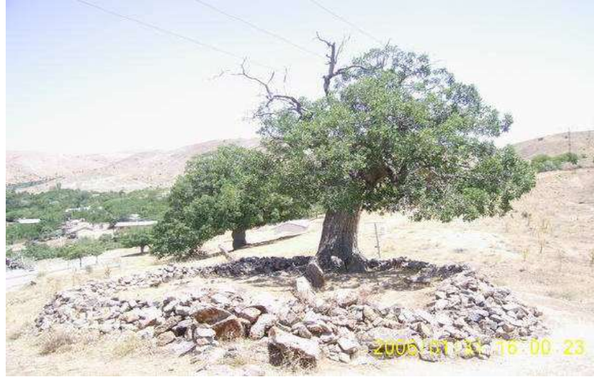
Resim 99: Mirab'ın Mezarı