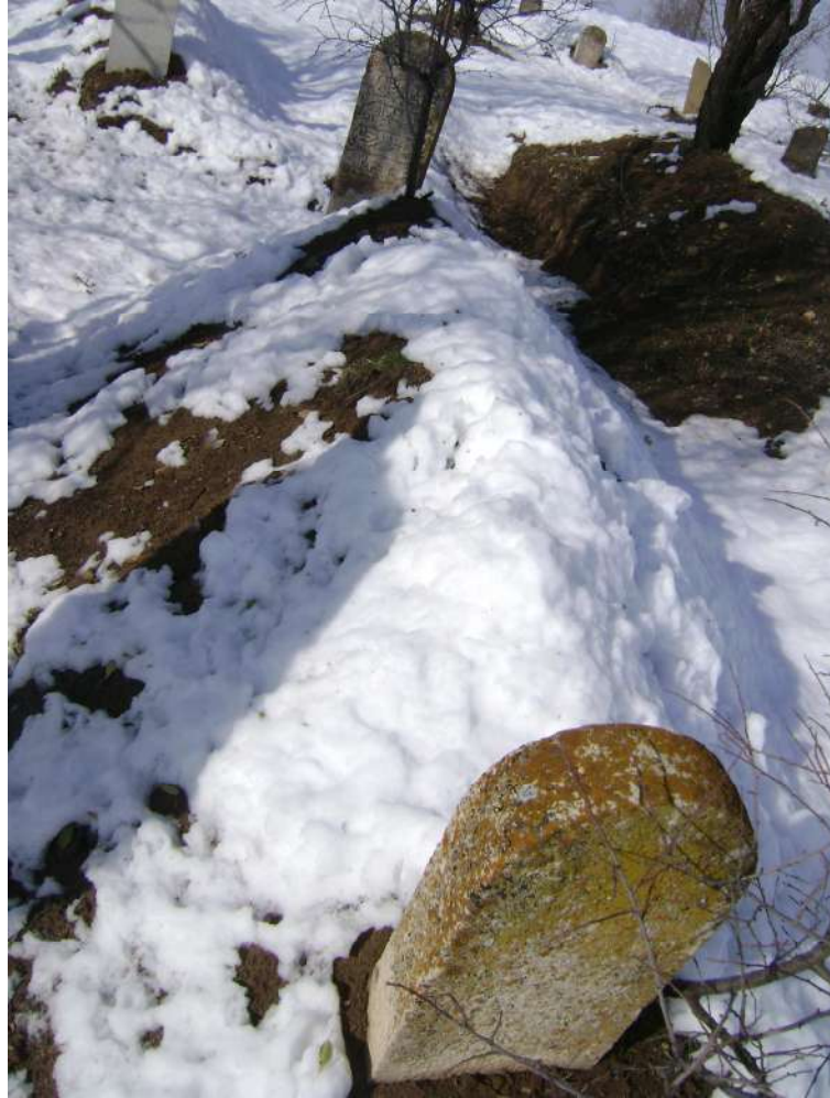
Resim 54: Hoca İbrahim Mezarı