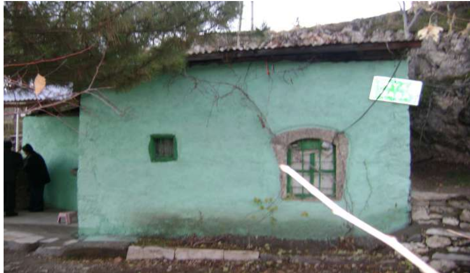
Resim 9: Tesbih Baba Türbesi dıştan görünüşü