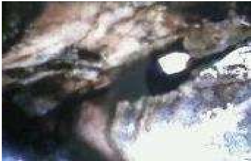
Resim 52: Delikli Taş