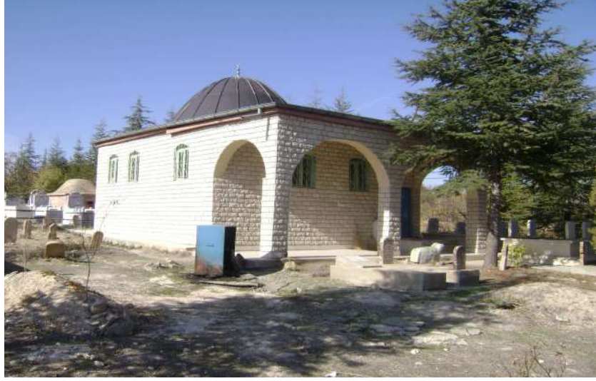
Resim 38: Ağuiçen Koca Seyyid Ahmet Türbesi dıştan görünüşü