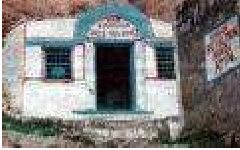
Resim 58: Abdulvehhab Gazi Türbesi dıştan görünüşü