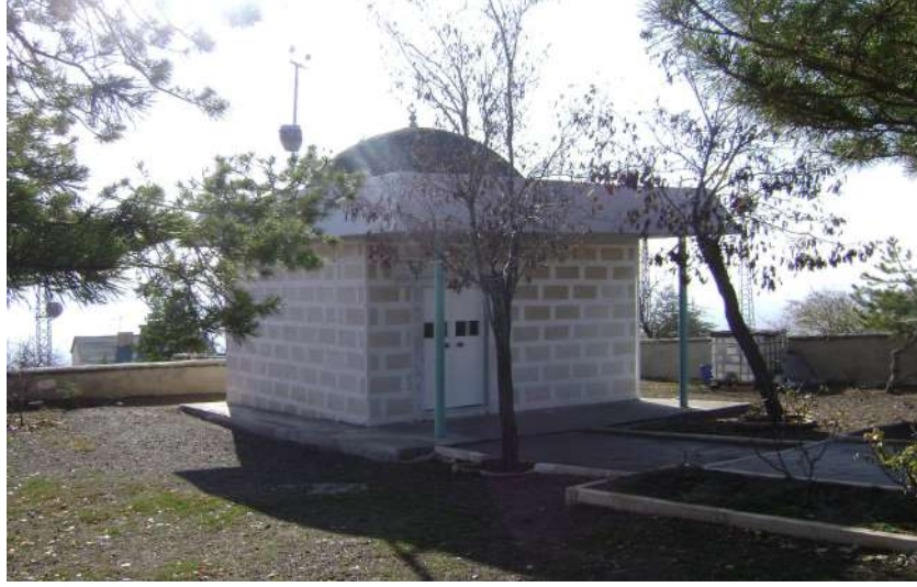
Resim 17: Tayyar Baba Türbesi dıştan görünüm