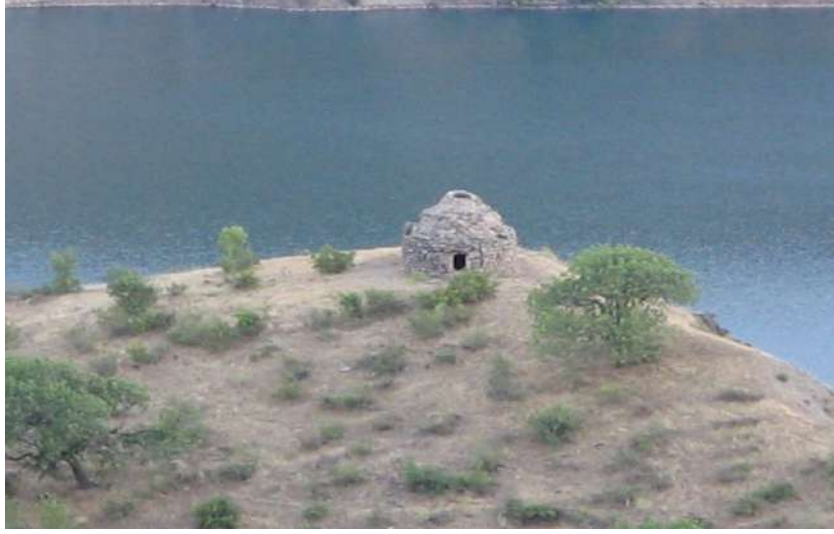
Resim 122: Abu Tahir Ziyaret Kümbeti