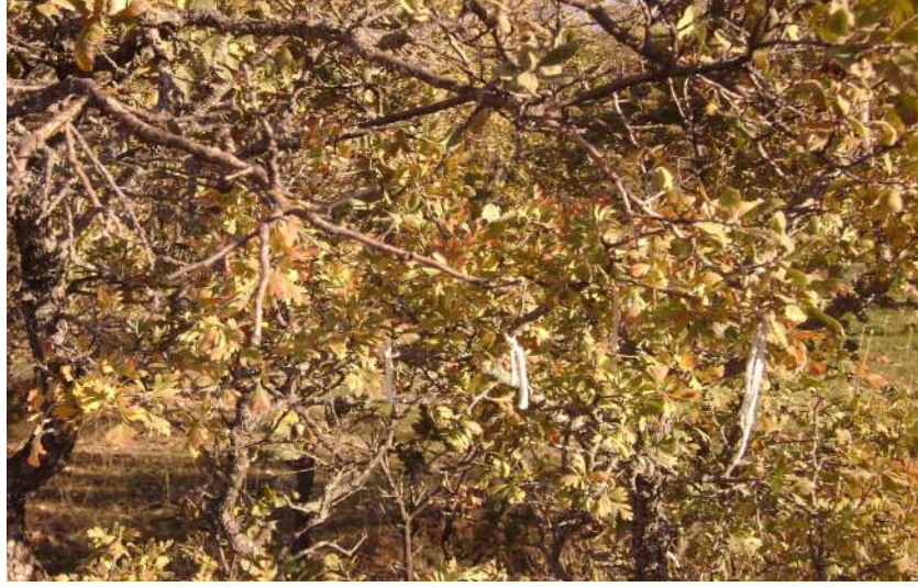
Resim 86: Şengül Baba Mezarı dilek ağacı