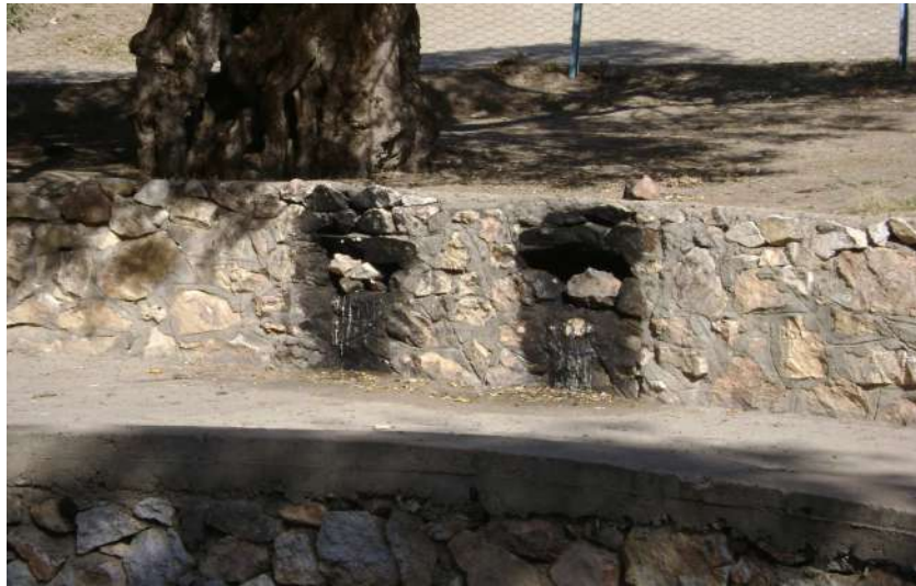
Resim 94: Piri Davut Türbesi mum yakma yeri