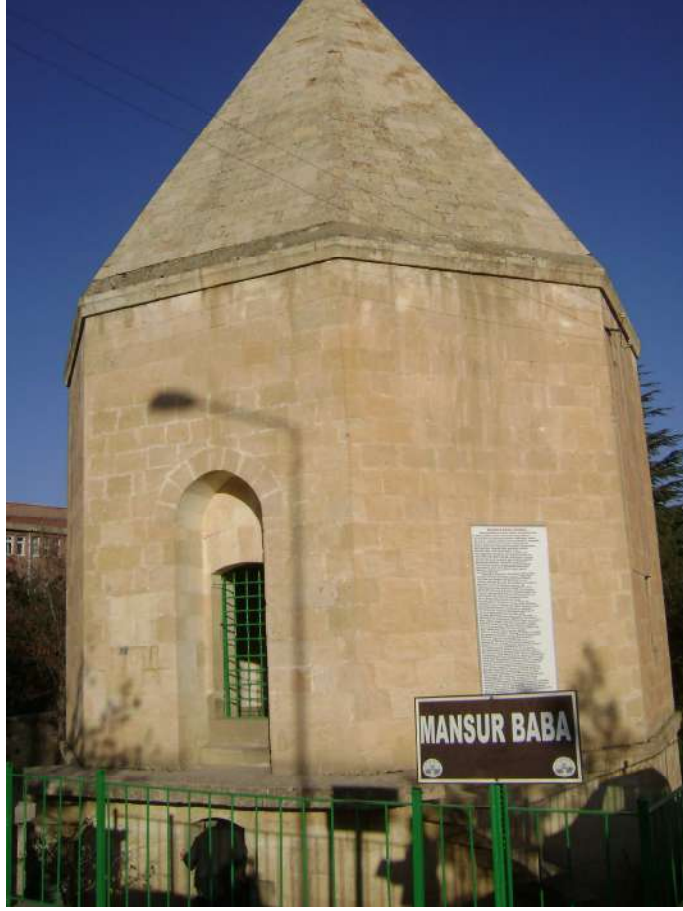
Resim 15: Mansur Baba Türbesi dıştan görünüşü