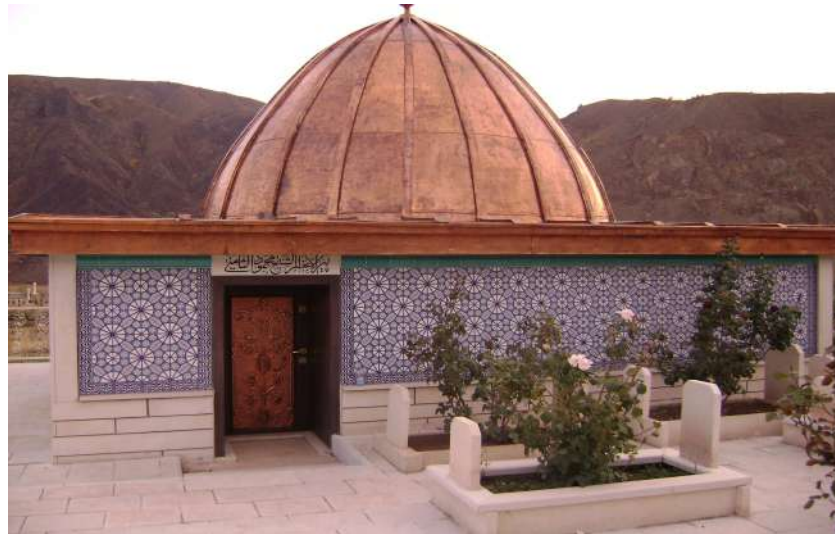
Resim 112: Mahmut Samini Türbesi dıştan görünüşü