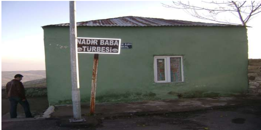
Resim 12: Nadir Baba Türbesi dıştan görünüşü