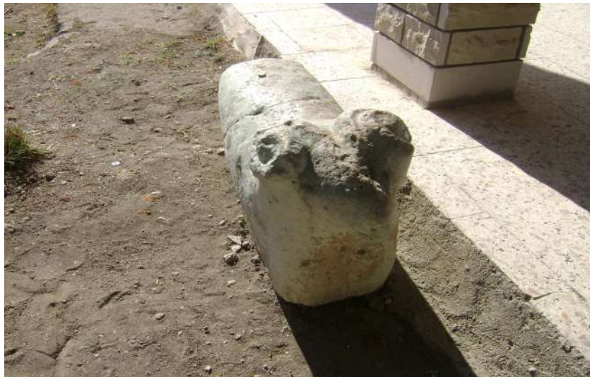
Resim 40: Ağuiçen Koca Seyyid Ahmet Türbesi Koç Baba heykeli