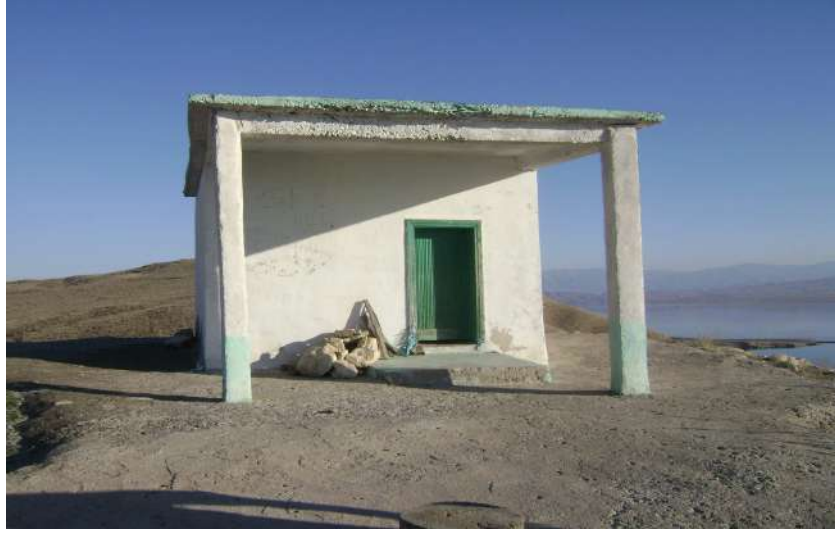
Resim 74: Hızır Baba Türbesi dıştan görünüşü