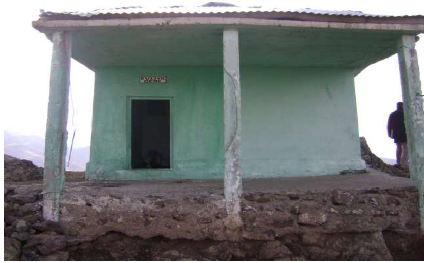
Resim 33: Evliya Dede Türbesi dıştan görünüşü