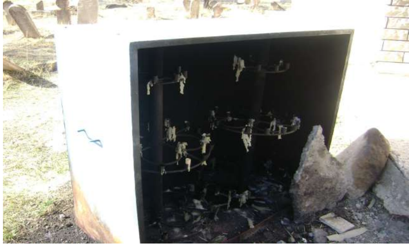
Resim 42: Ađuiçen Koca Seyyid Ahmet Türbesi Mum Yakma Yeri