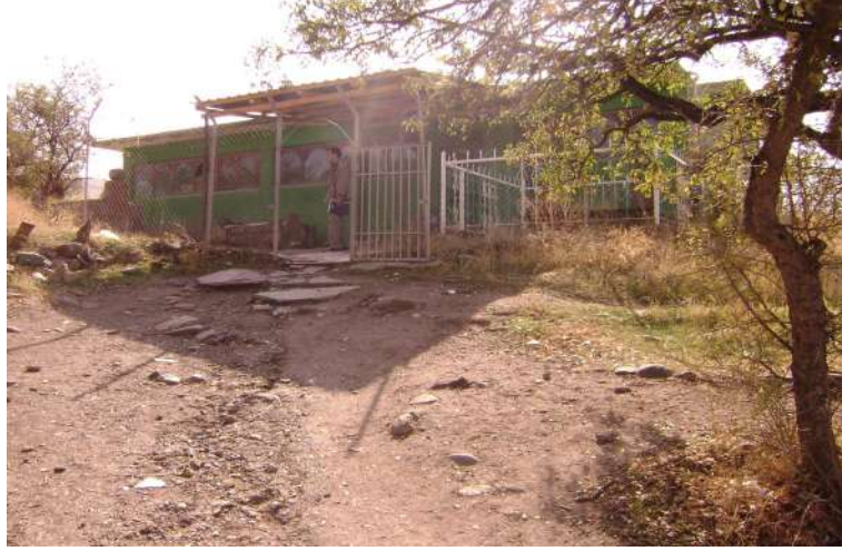
Resim 111: Şeyh Ali Sebti Türbesi dıştan görünüşü