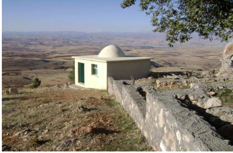
Resim 89: Ağ Baba Türbesi (Makamı)