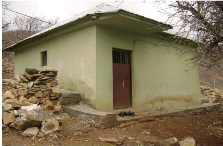
Resim 115: Molla Kasım Türbesi dıştan görünüşü