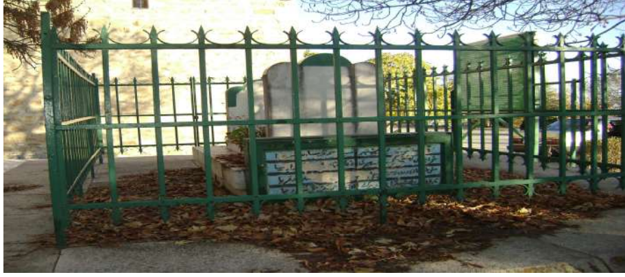
Resim 4: Seyyid Ahmet apakuri mezarı dıřtan grnř