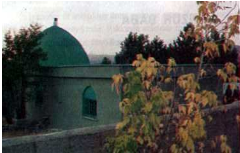
Resim 22: Haydar Baba Türbesi dıştan görünüşü