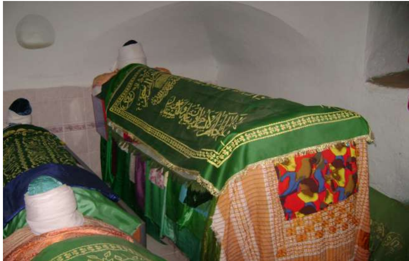
Resim 121: Şeyh Mustafa Türbesi içten görünüm