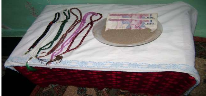
Resim 36: Abdulcabbar Efendi Türbesi řifa toprađı