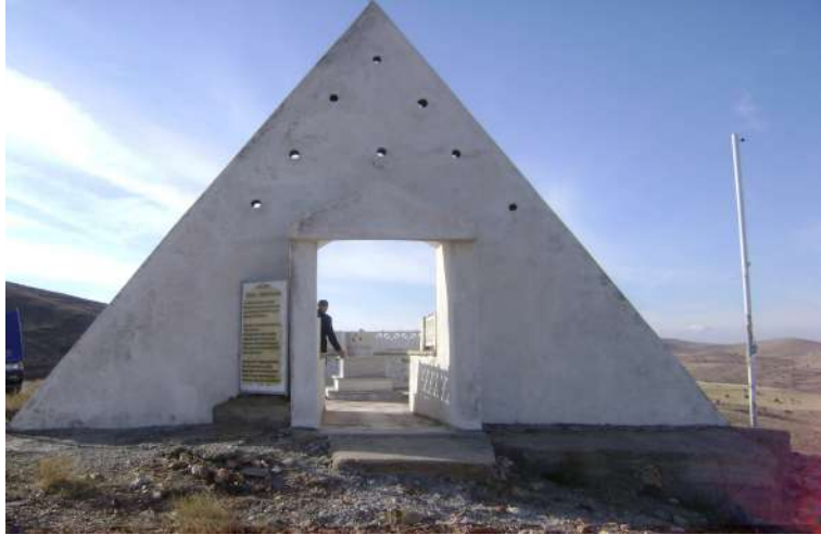
Resim 48: Hıdır Baba Türbesi dıştan görünüşü