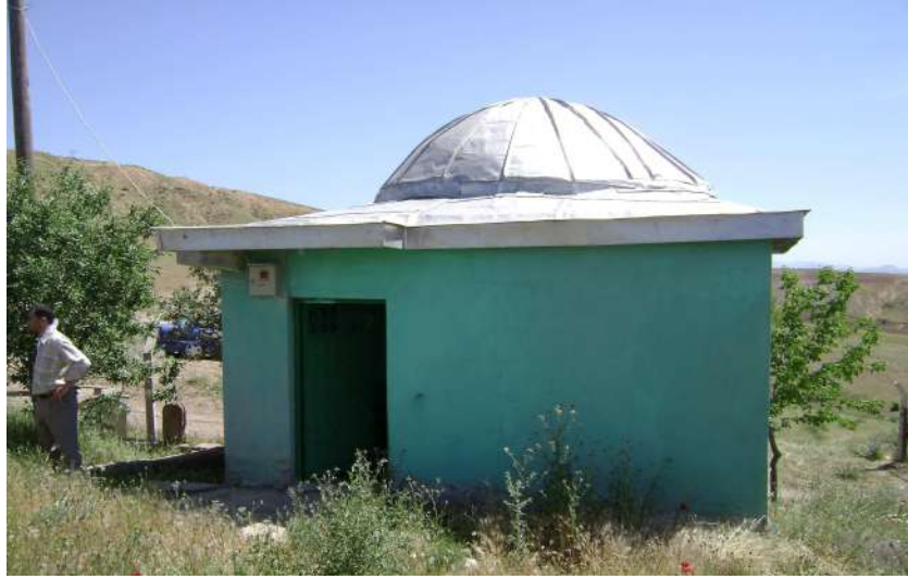
Resim 108: Aziz Baba Türbesi dıştan görünüm