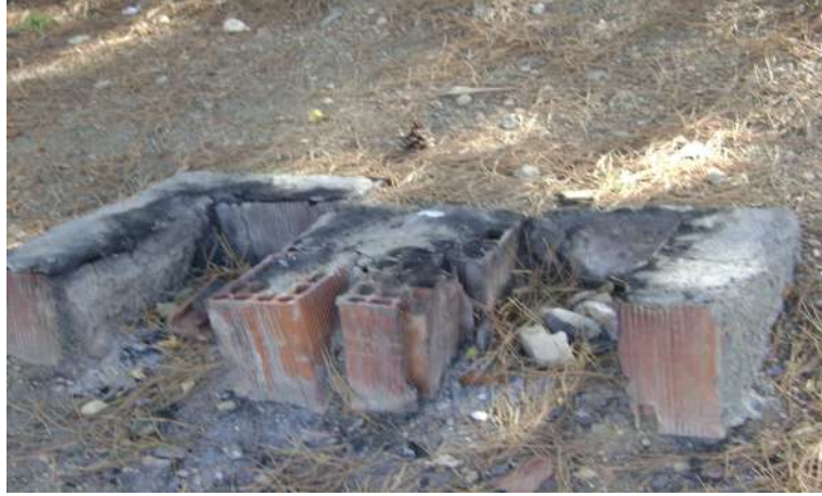
Resim 96: Piri Davut Türbesi yemek ocağı