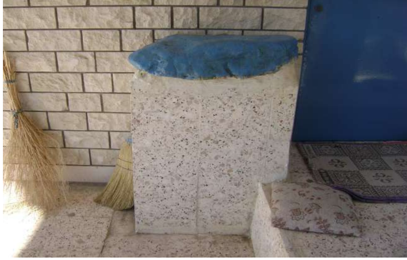
Resim 41: Ađuiçen Koca Seyyid Ahmet Türbesi Niyas Taşı