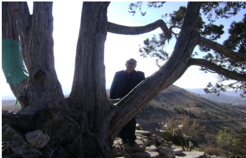
Resim 46: Selvi Baba Ziyareti