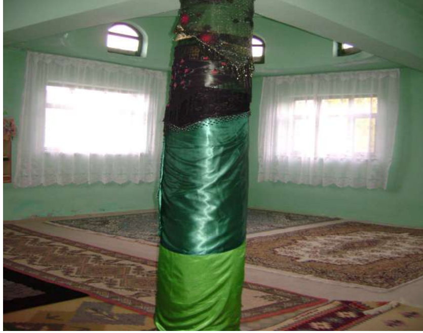
Resim 35: Abdulcabbar Efendi Türbesi dilek diređi