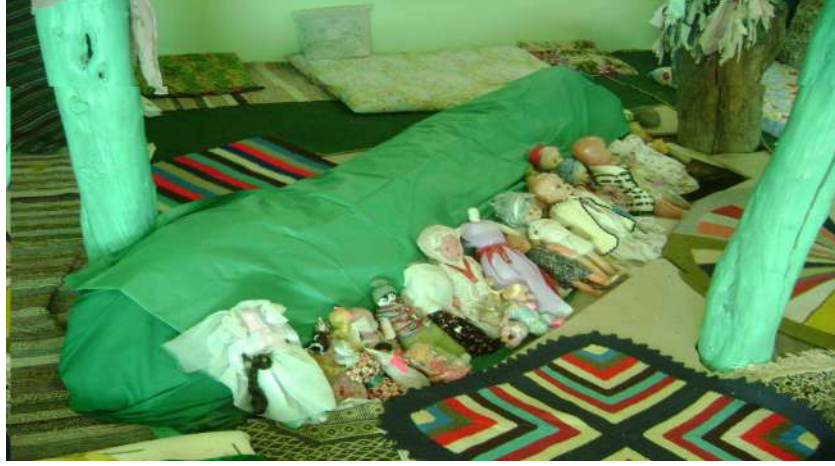
Resim 44: Kara Arap Türbesi içten görünüm