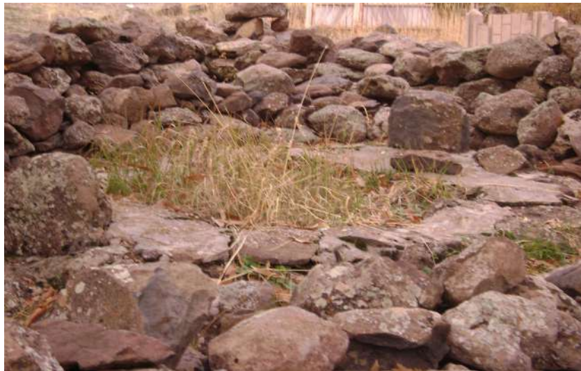
Resim 82: Garip Baba Mezarı