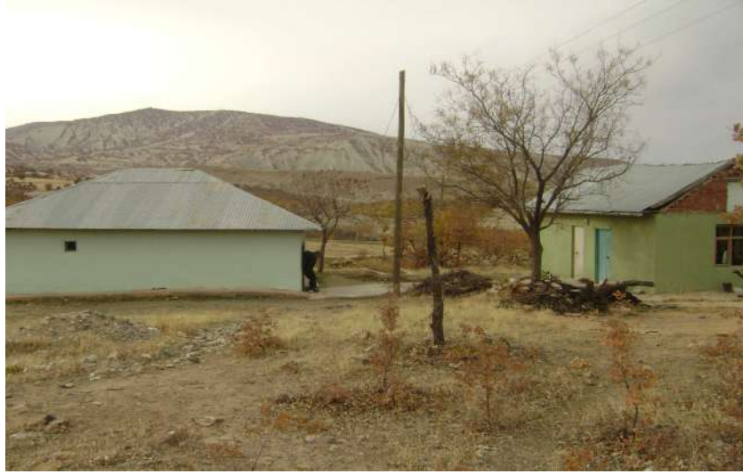
Resim 62: Pir Kemal Türbesi