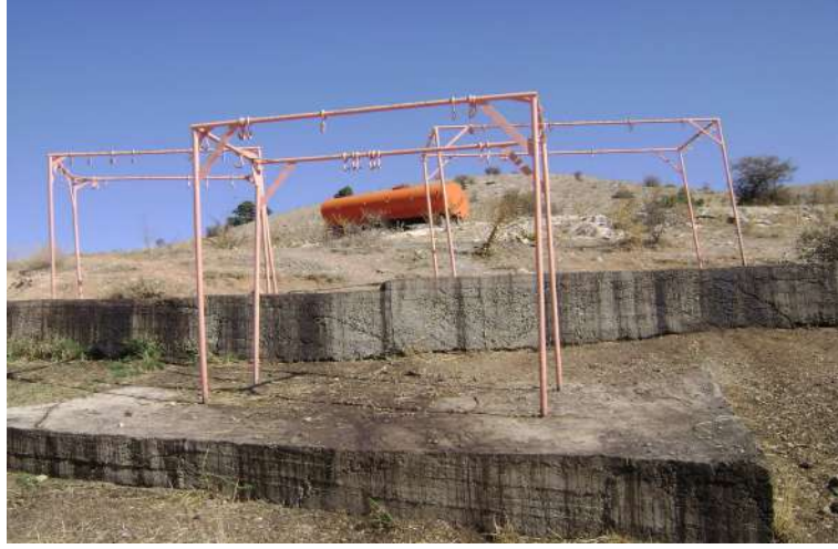
Resim 95: Piri Davut Türbesi kurban kesim yeri