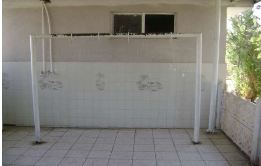
Resim 39: Ağuiçen Koca Seyyid Ahmet Türbesi kurban kesim yeri