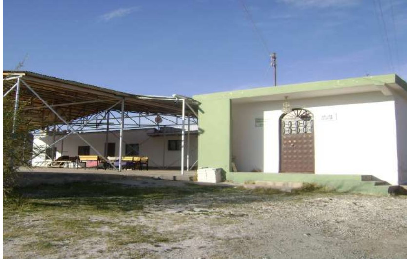
Resim 45: Ağu İçen Evlatları Türbesi dıştan görünüşü