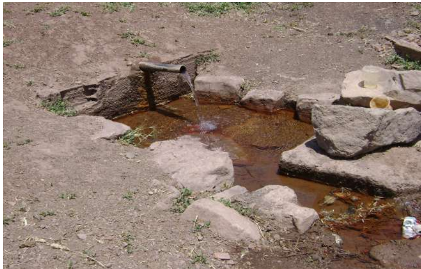
Resim 109: Çelebi Köyü Şifalı Su