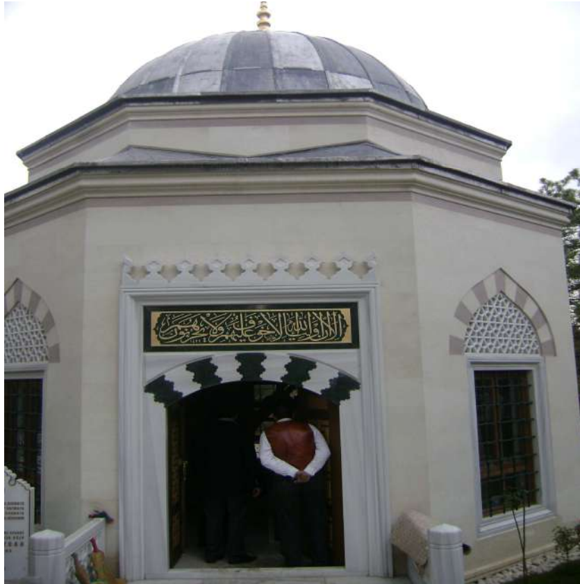
Resim 20: Hacı Muharrem Hilmi Efendi Türbesi dıştan görünüşü