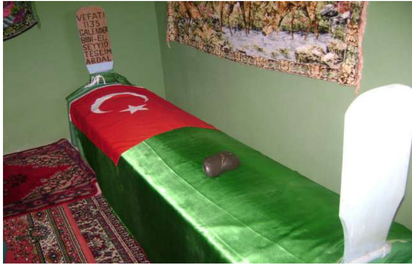
Resim 70: Teslim Abdal Türbesi içten görünüm