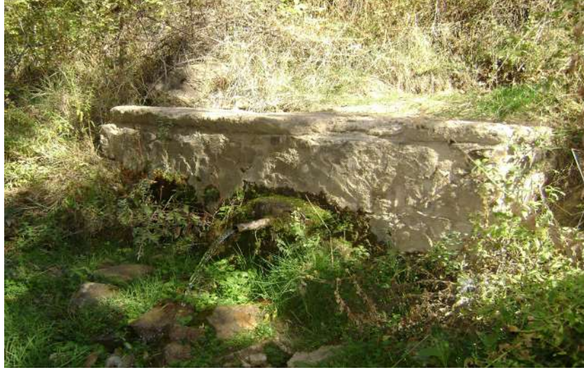
Resim 102: Taşkese Ziyareti eşme