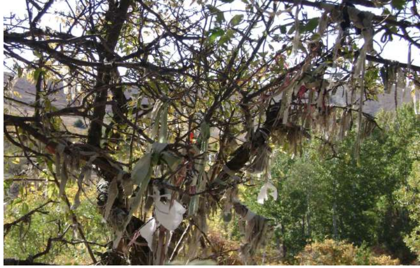
Resim 98: Piri Davut Türbesi dilek ağacı