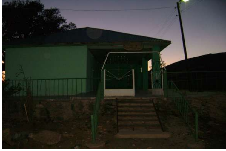
Resim 110: Muhammed Kattal Türbesi dıştan görünüşü