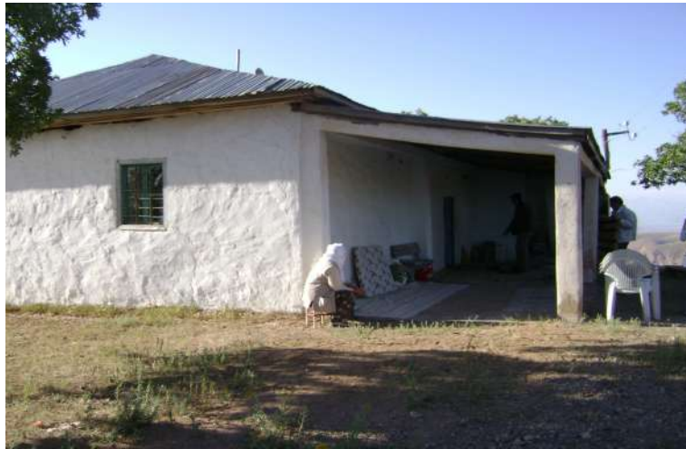
Resim 88: Pir (Seyyid) Hasan Zerraki Türbesi dıştan görünüşü