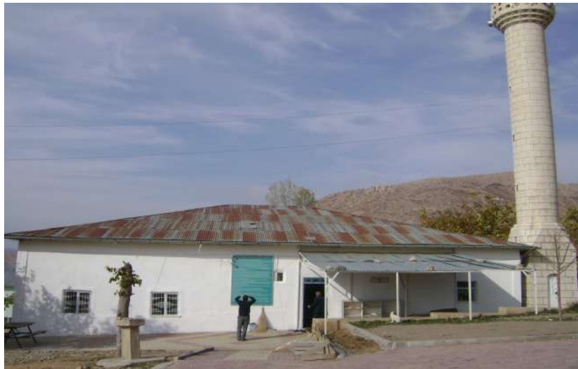
Resim 57: Hacı Hasan Baba Türbesi dıştan görünüşü