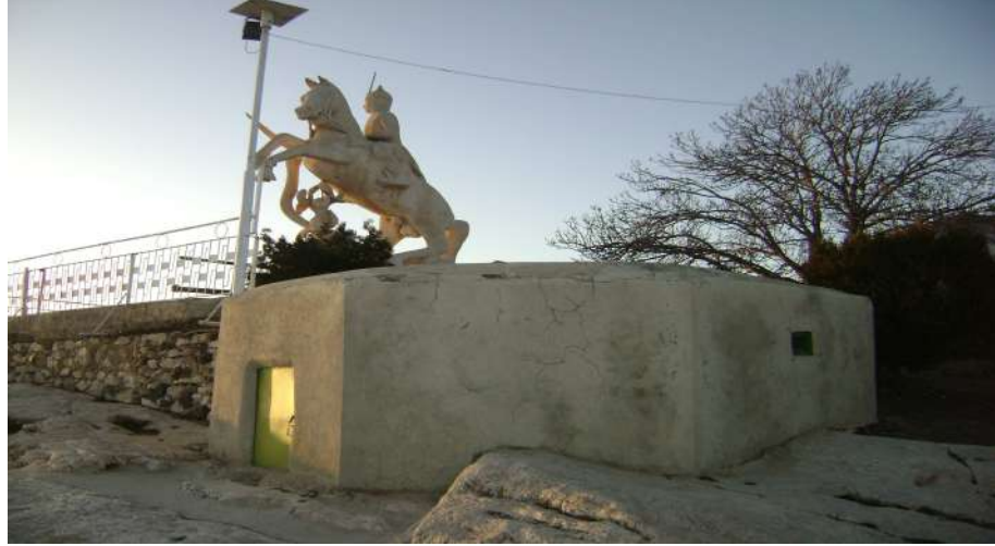
Resim 8: Beşikli Baba Türbesi dıştan görünüşü