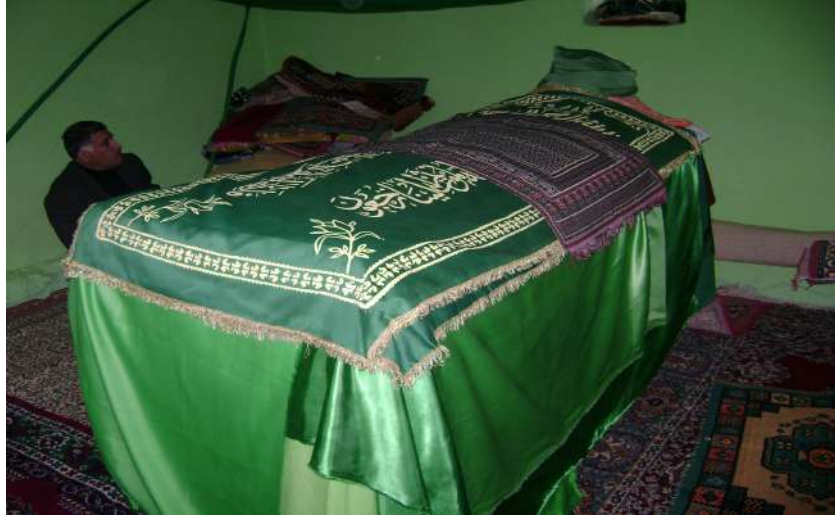
Resim 120: Şeyh Alaattin Türbesi içten görünüm