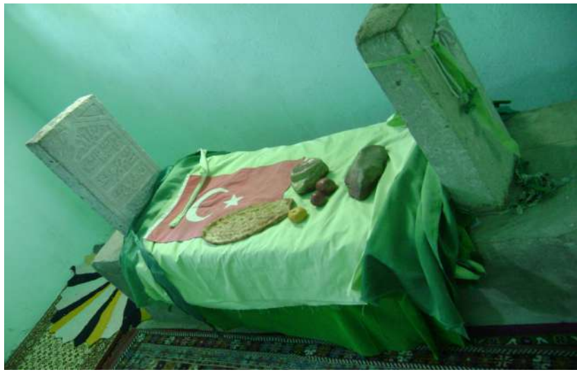
Resim 67: Derviş Ali Türbesi içten görünüm