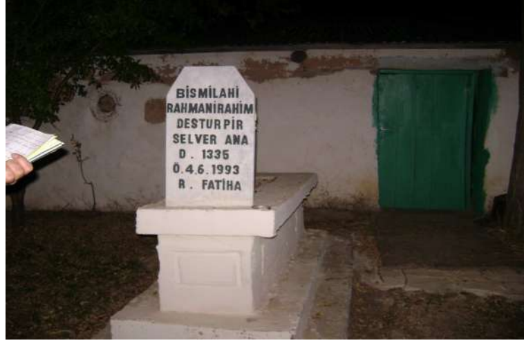
Resim 104: Sultan Sinemilli Evlatları