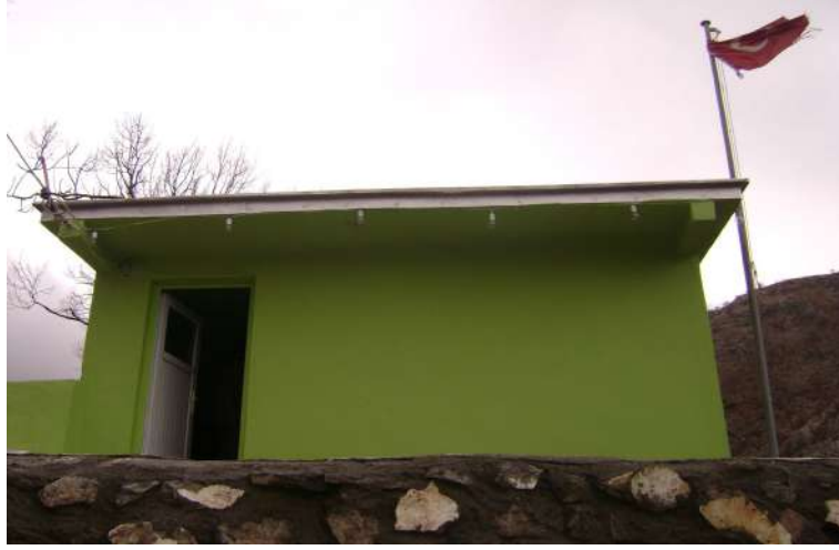
Resim 113: Şeyhmir Türbesi dıştan görünüşü