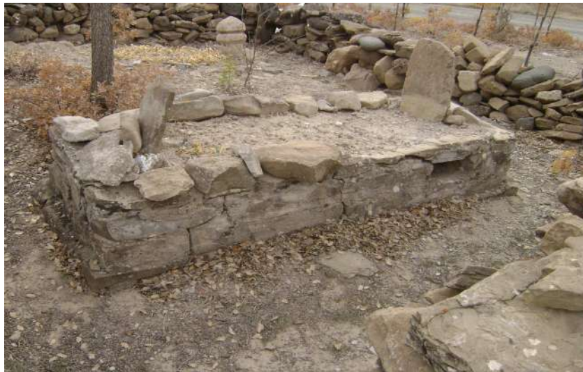
Resim 63: Molla Süleyman Mezarı