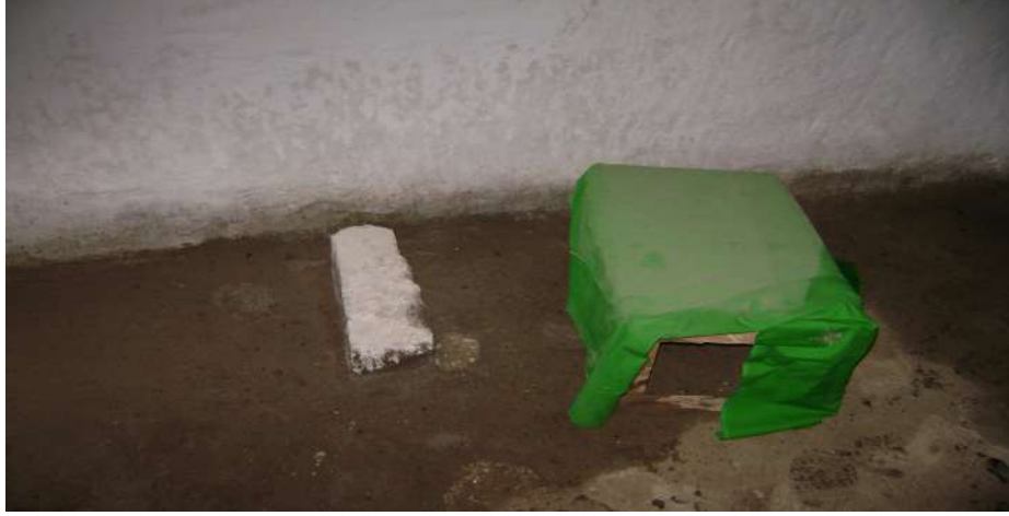
Resim 26: Çarşamba Baba