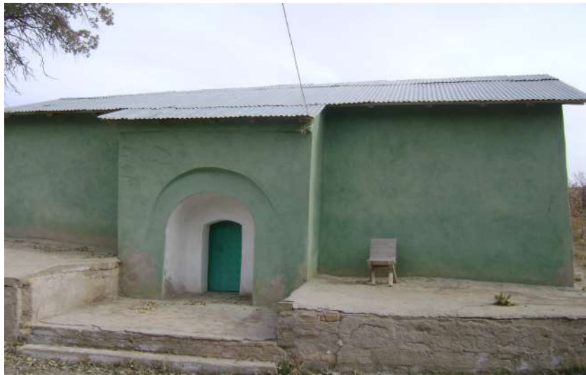
Resim 60: Musa Hervi Türbesi dıştan görünüşü