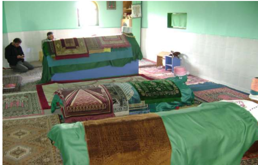
Resim 106: Mir Mehmetli Hacı Cuma Efendi Türbesi içten görünüm