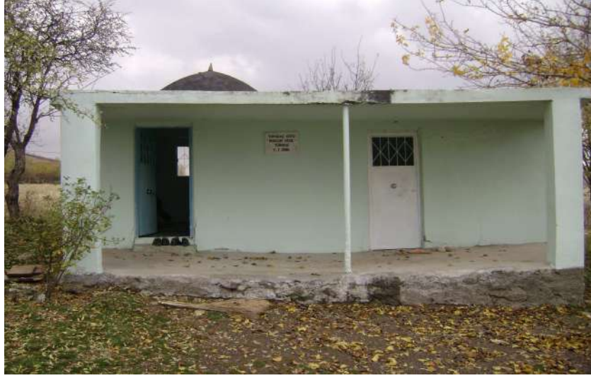
Resim 107: Munzur Dede Türbesi dıştan görünüm