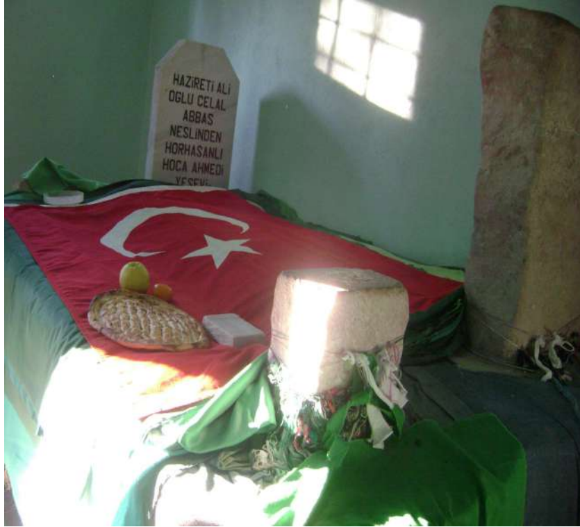
Resim 65: Şeyh Ahmet Dede Türbesi içten görünüm