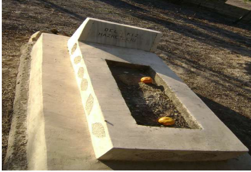
Resim 68: Deli Kız Mezarı