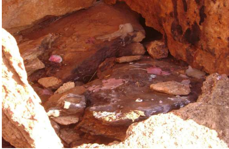
Resim 87: Şengül Baba Mezarı mum yakma yeri