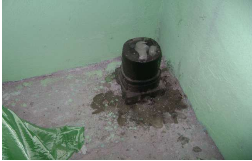
Resim 72: Hasan El Mekki Türbesi mum yakma yeri