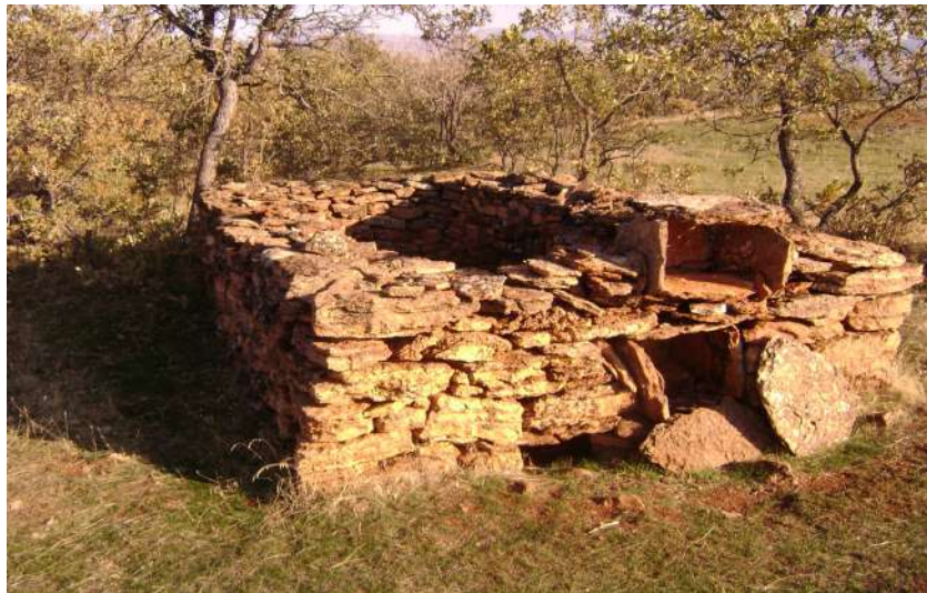
Resim 85: Şengül Baba Mezarı