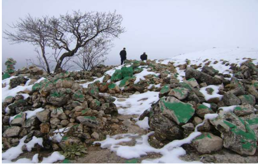
Resim 53: Ziyaret Tepesi Siyamet Mezarı