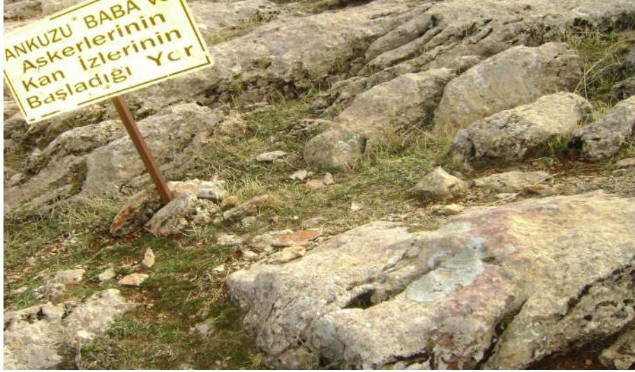
Resim 14: Ankuzu Baba'nın ve Askerlerinin Kan İzleri