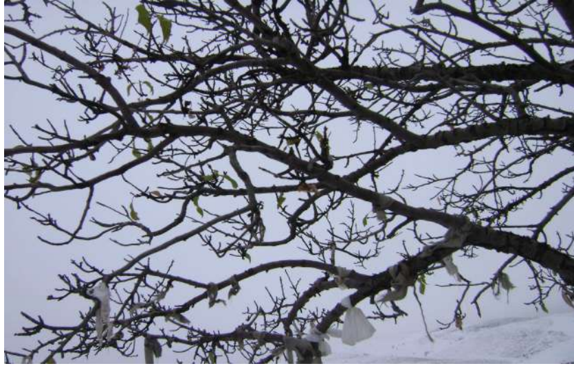
Resim 51: Sarılık Suyu Dilek Ağacı