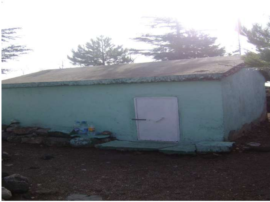
Resim 13: Ankuzu Baba Türbesi dıştan görünüşü