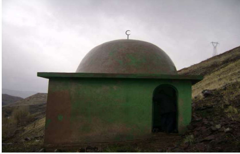
Resim 77: Gözerekli Molla Muhammed Türbesi dıştan görünüşü