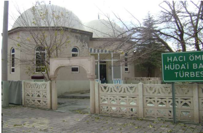
Resim 28: Ömer Hüda-i Baba dıştan görünüşü