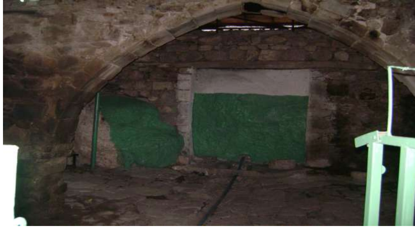
Resim 24: Seydiye Hanım Çeşmesi ve Dilek Taşı