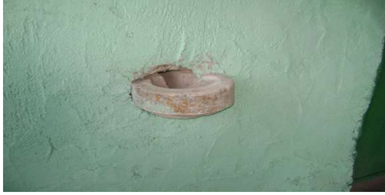
Resim 10: Tesbih Baba Türbesi Sadaka Taşı