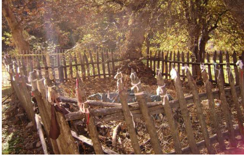
Resim 83: Güzel Baba Mezarı