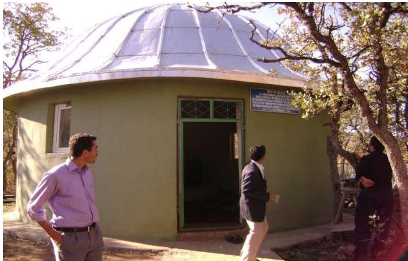
Resim 79: Seyyid İbrahim (Sefkâr Baba) Türbesi dıştan görünüşü