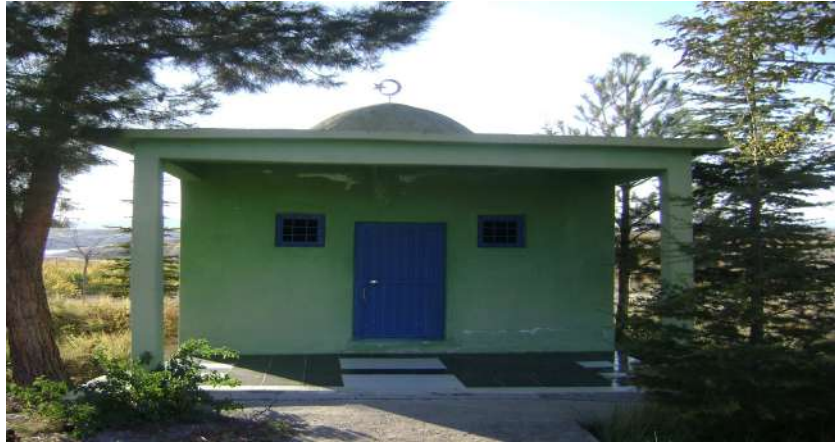
Resim 69: Teslim Abdal Türbesi dıştan görünüşü