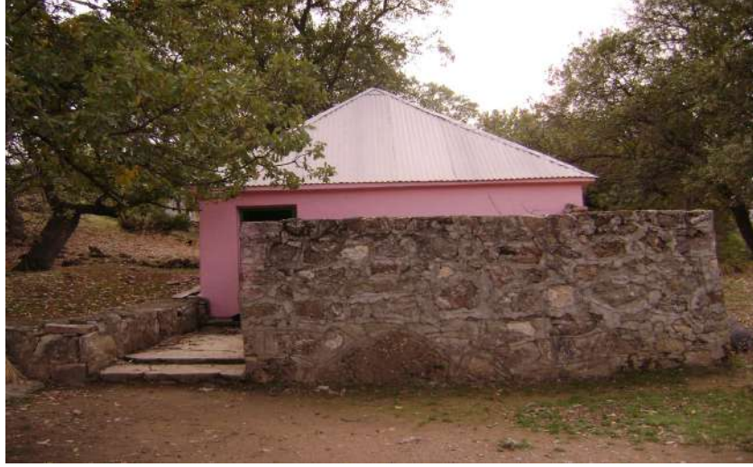
Resim 119:Şeyh Alaattin Türbesi dıştan görünüşü