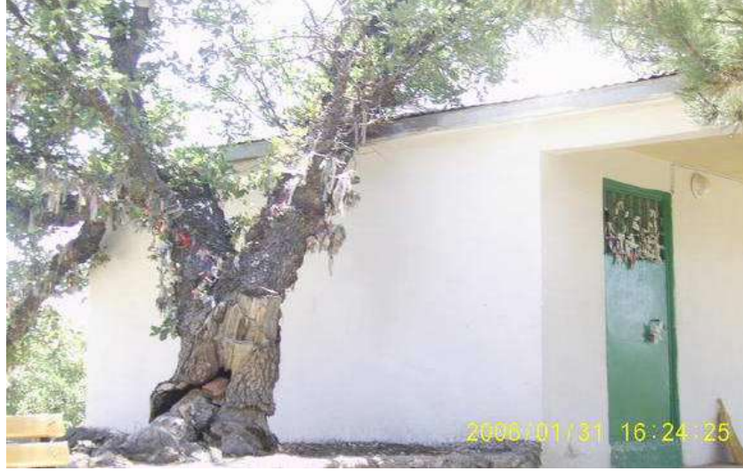
Resim 93: Piri Davut Türbesi dıştan görünüşü