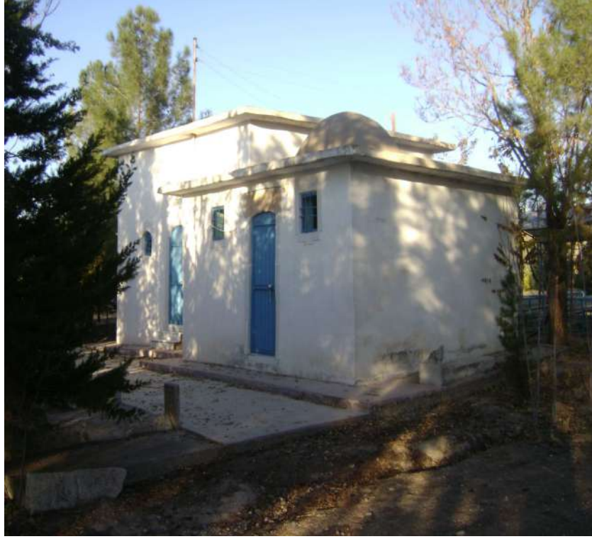
Resim 64: Şeyh Ahmet Dede Türbesi dıştan görünüşü