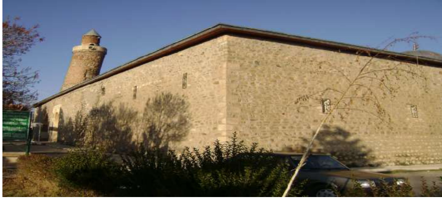
Resim 5: Harput Ulu Camii