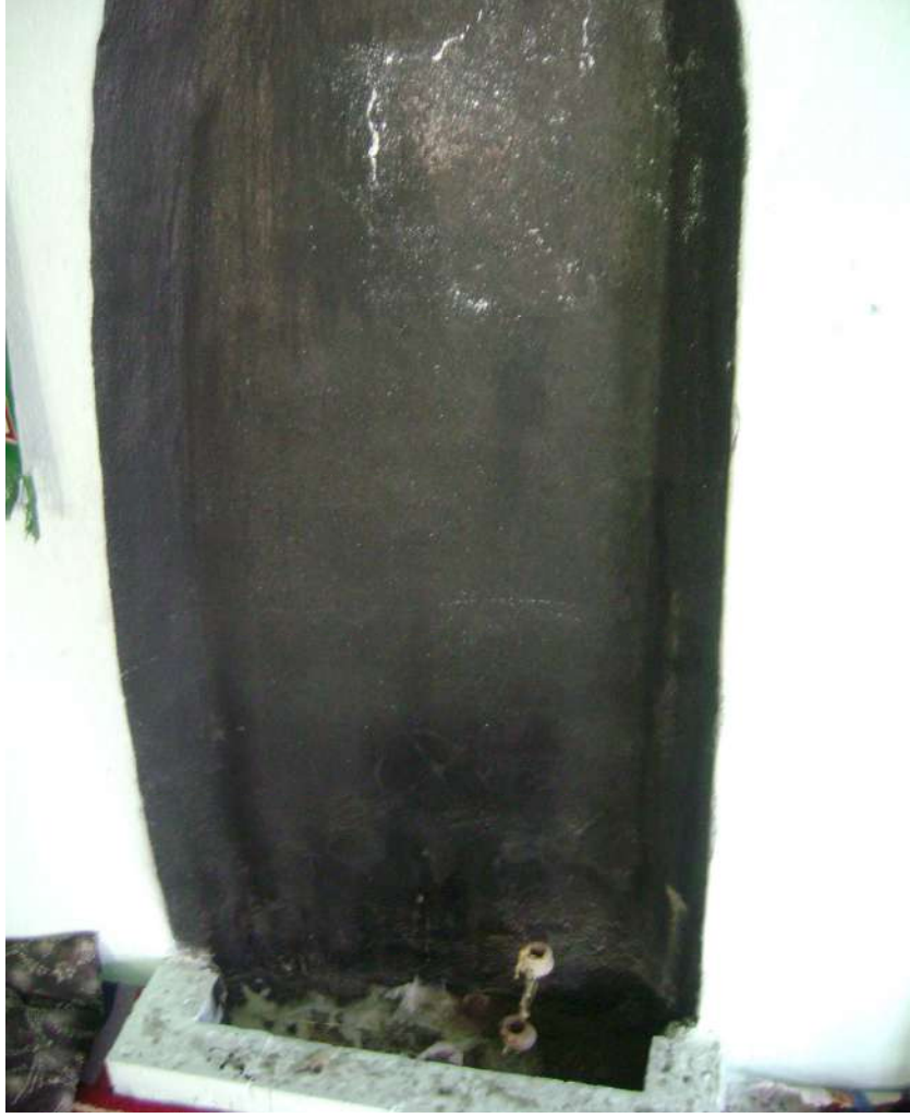
Resim 66: Şeyh Ahmet Dede Türbesi mum yakma yeri