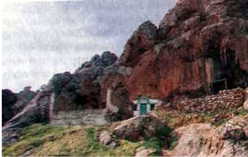
Resim 59: Abdulvehhab Gazi Türbesi dıştan görünüşü