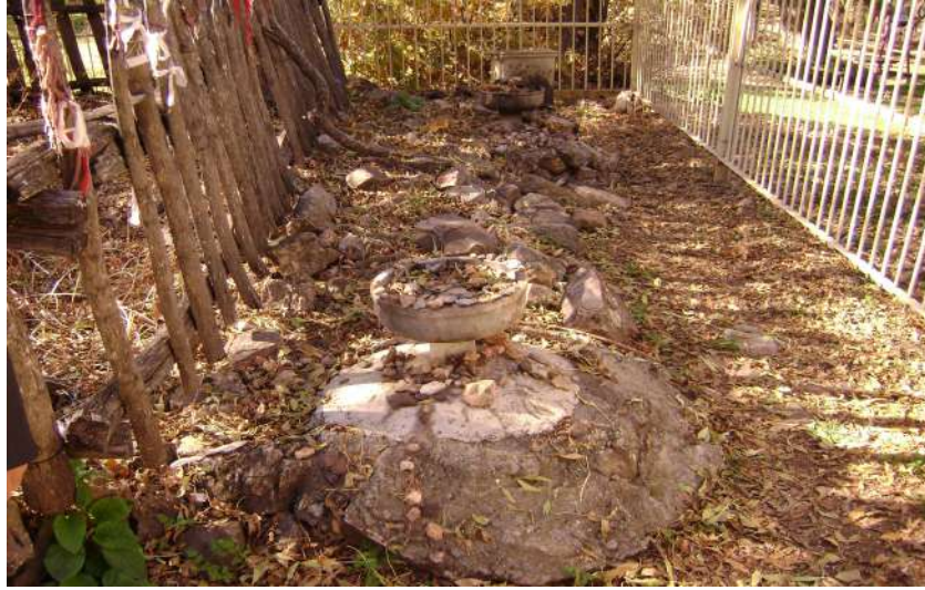
Resim 84: Güzel Baba Mezarı mum yakma yeri