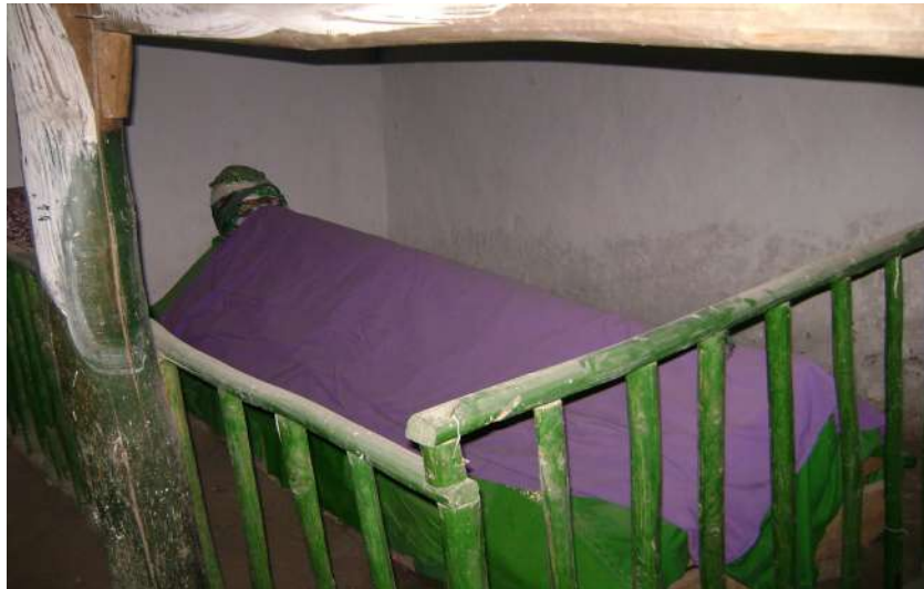
Resim 25: Çarşamba Baba