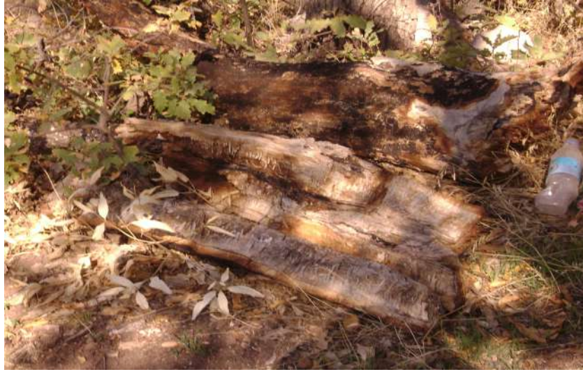
Resim 81: Pir Cemal Abdal Türbesi kurumuş ağaç kalıntısı