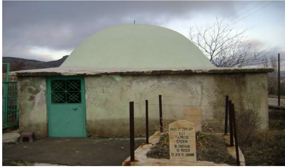
Resim 27: Ayşe Ana Türbesi dıştan görünüşü