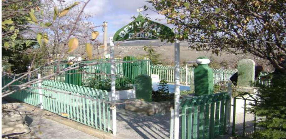
Resim 2: Beyzade Efendi Türbesi dıştan görünüşü