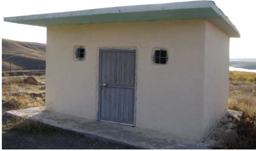
Resim 71: Hasan El Mekki Türbesi dıştan görünüşü