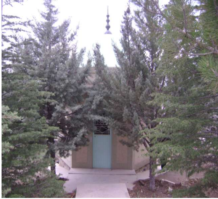
Resim 21 : Demirci Mustafa Efendi Türbesi dıştan görünüşü