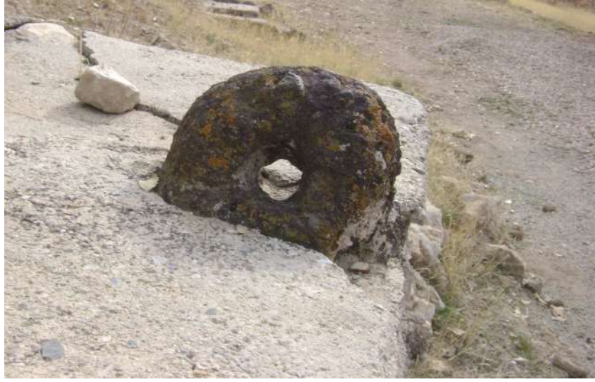
Resim 61: Musa Hervi Türbesi Delik Taş