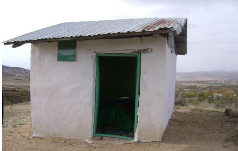
Resim56: Ziyaret Tepesi