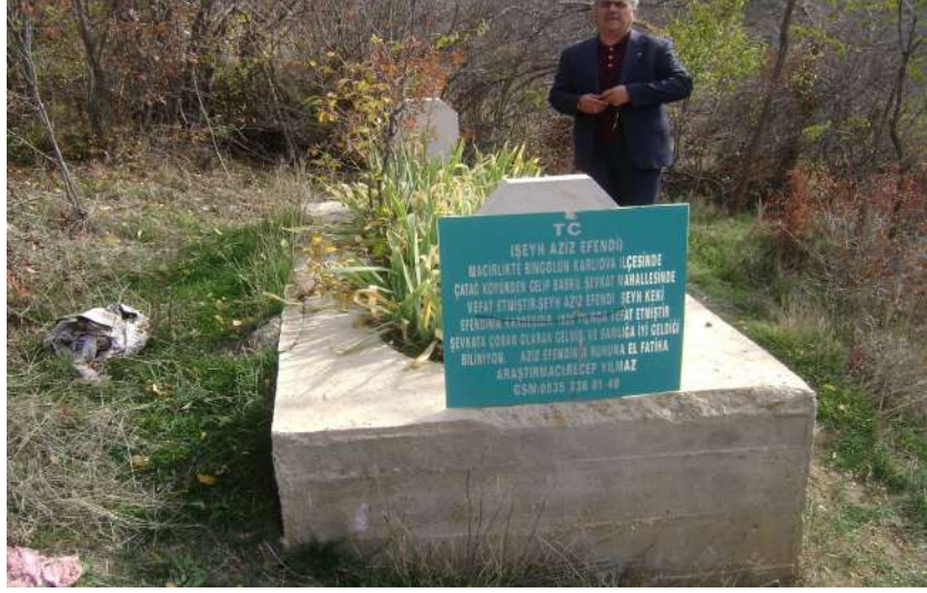
Resim 55: Şeyh Aziz Efendi Mezarı