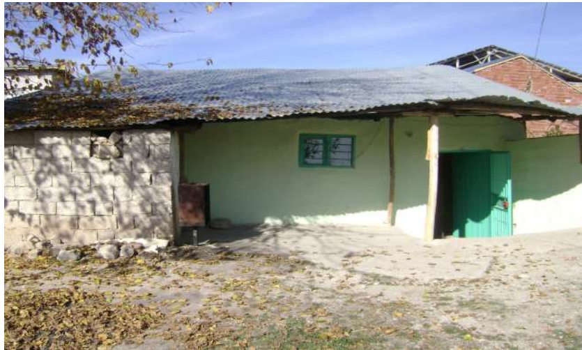
Resim 43: Kara Arap Türbesi dıştan görünüşü