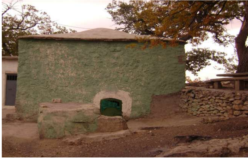
Resim 91: Sinemilli Türbesi dıştan görünüşü