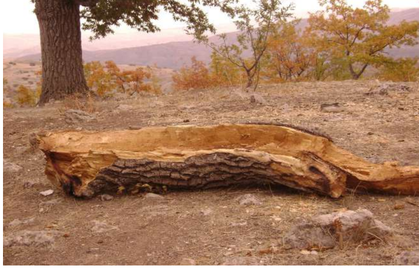
Resim 92:Sinemilli Türbesi 'nde kurumuş ağaç