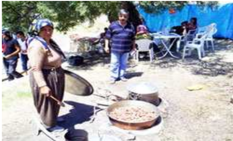
Resim 97: Piri Davut Türbesi Güz Öküzü Şenliği