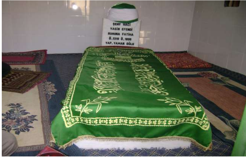
Resim 118: Hacı Yasin Efendi Türbesi içten görünüm