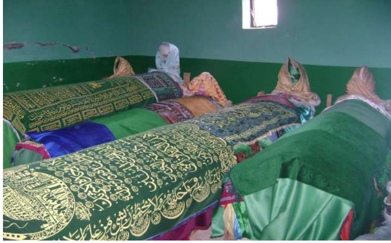
Resim 116: Molla Kasım Türbesi içten görünüm