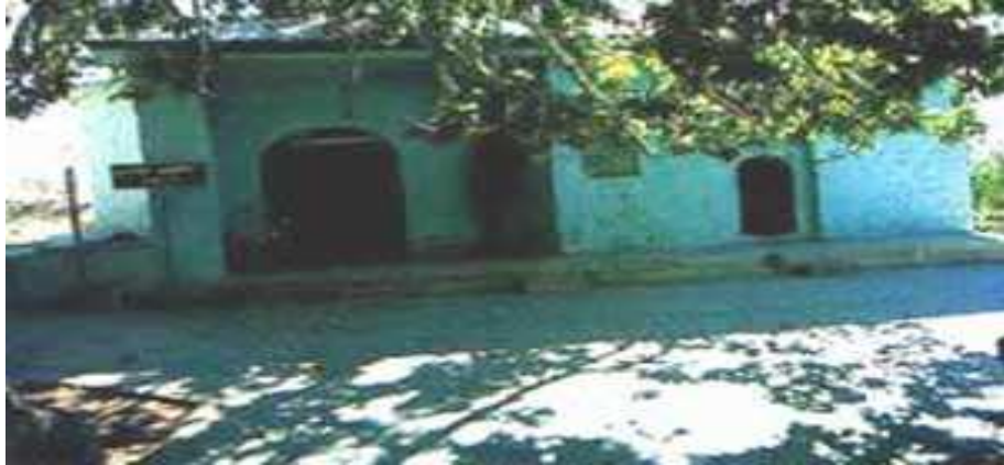
Resim 3: Fatih Ahmet Baba Türbesi dıştan görünüşü