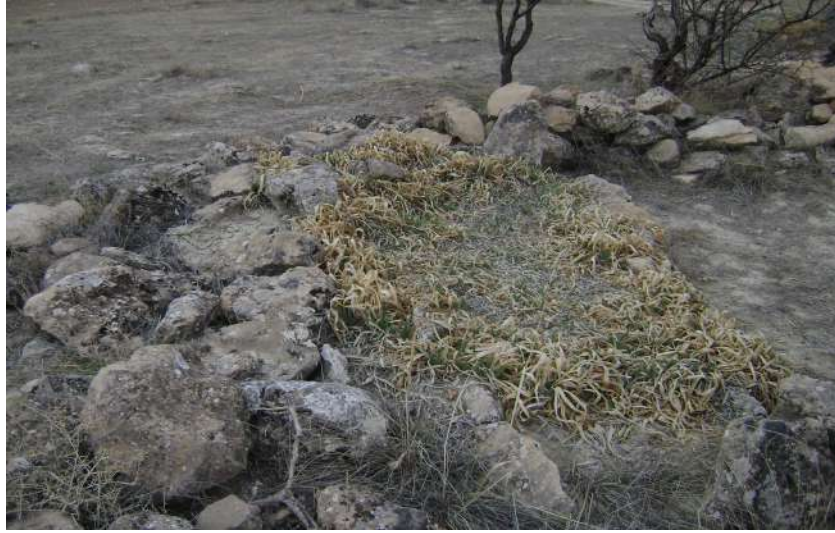
Resim 75: Şeyh Seyyid Mezarı