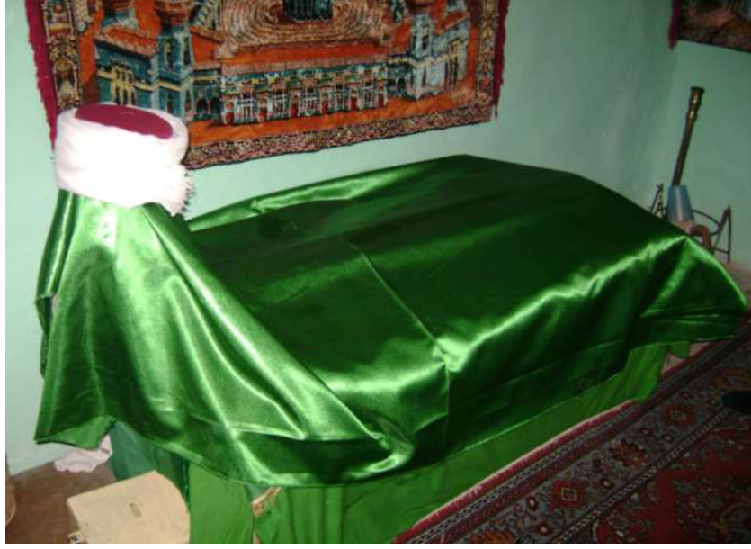
Resim 23: Seyyid Kasım Türbesi içten görünüm