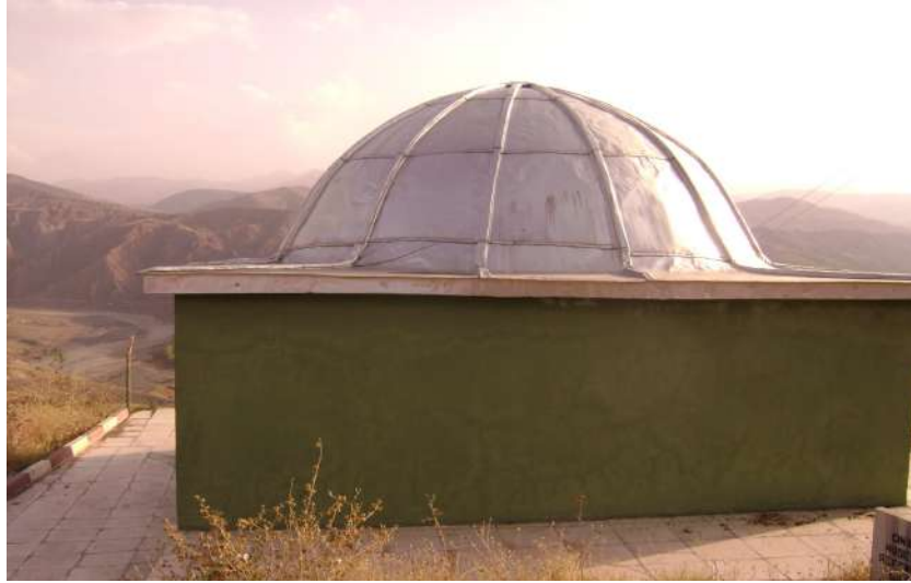
Resim 117: Hacı Yasin Efendi Türbesi dıştan görünüşü