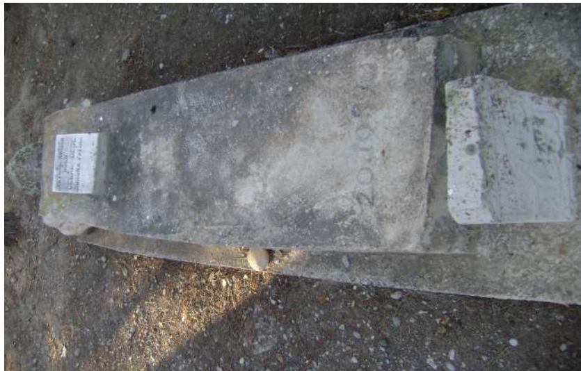
Resim 73: Celal Dede Mezarı