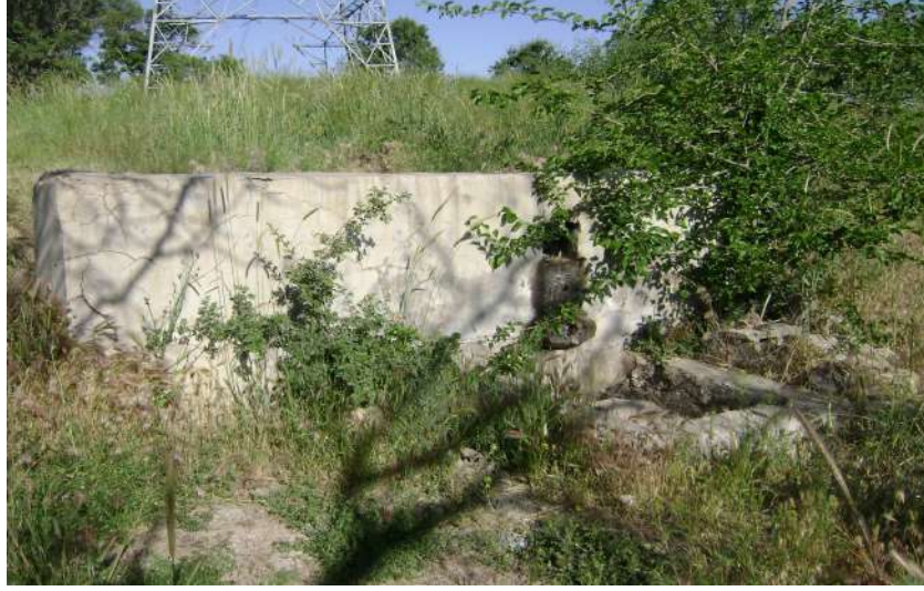
Resim 50: Sarılık Suyu