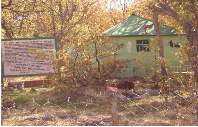
Resim 80: Pir Cemal Abdal Türbesi dıştan görünüşü