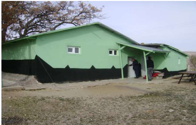
Resim 37: Sait Tayyar Türbesi dıřtan görünüşü