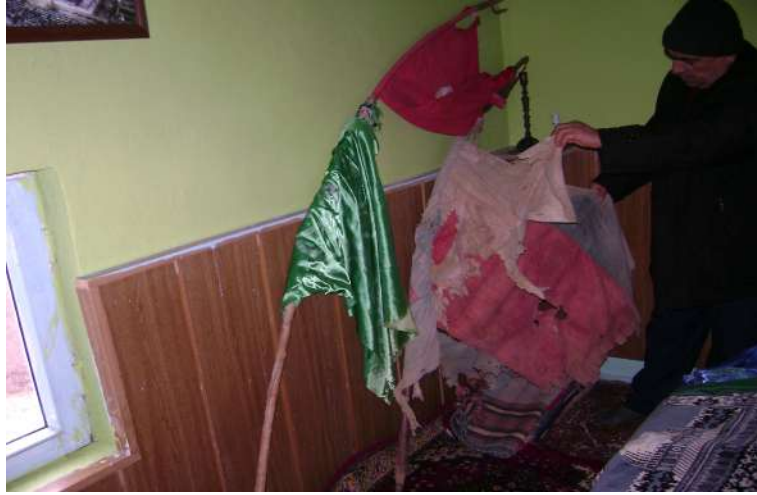
Resim 114: Şeyhmir'in sanca, tuğ ve bayrağı