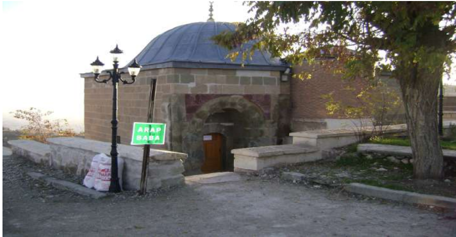
Resim 6: Arap Baba Trbesi dıřtan grnř