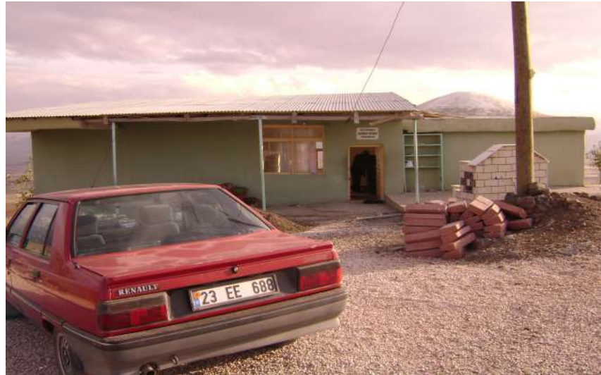
Resim 31: Miyadınlı Mehmet Efendi Türbesi dıştan görünüşü