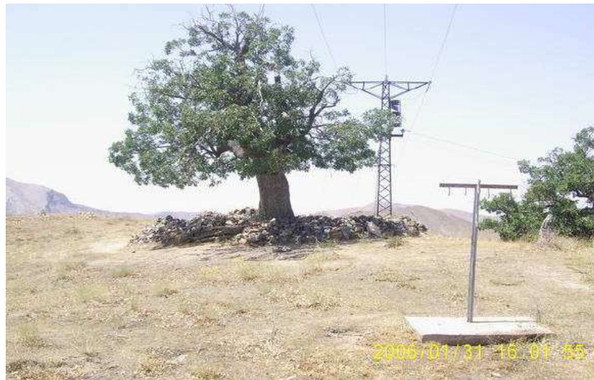
Resim 100: Mirab Ziyareti kurban kesim yer