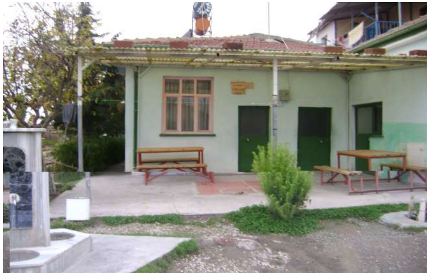
Resim 34: Abdulcabbar Efendi Türbesi dıştan görünüşü