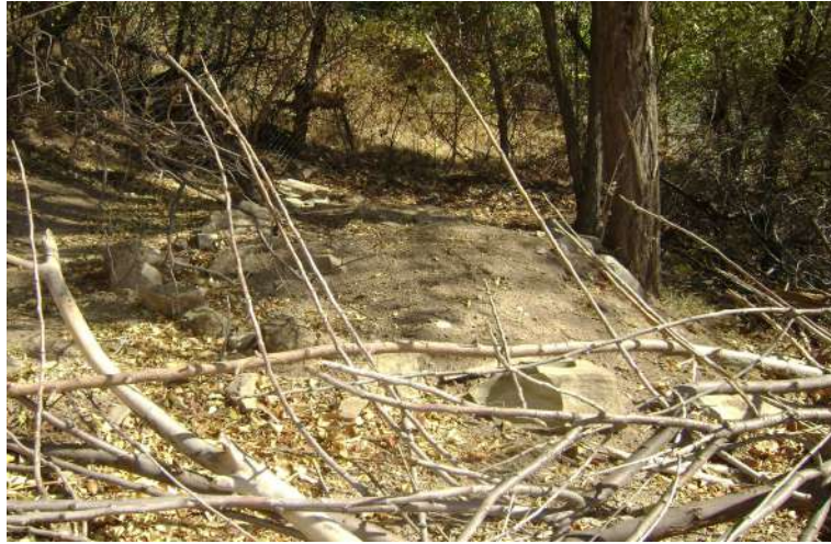
Resim 103: Köyaltı Ziyaret Mezarı