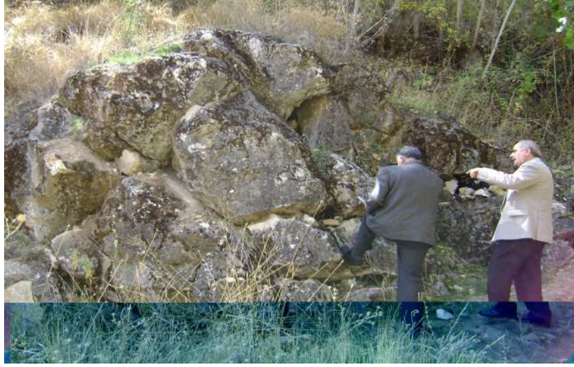
Resim 101: Taşkese Ziyareti