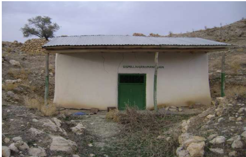
Resim 76: Yusuf Baba Türbesi dıştan görünüşü