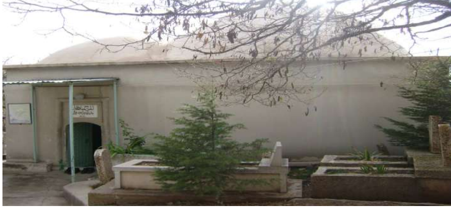
Resim 1: İmam Efendi Türbesi dıştan görünüşü