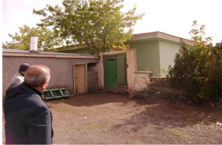
Resim 105: Mir Mehmetli Hacı Cuma Efendi Türbesi dıştan görünüşü