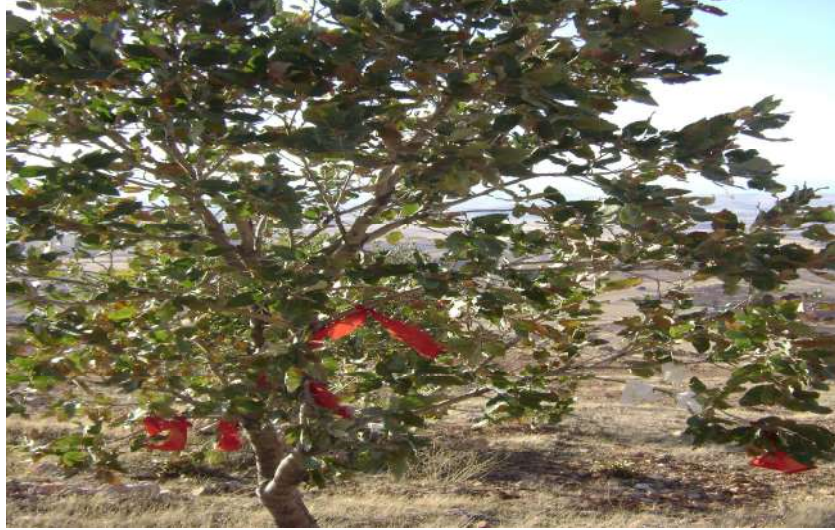
Resim 90: Ağ Baba Türbesi (Makamı) dilek ağacı