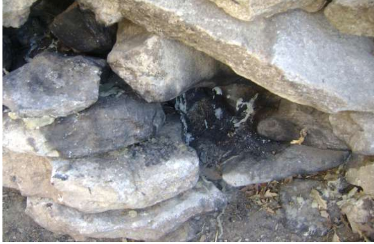
Resim 47: Selvi Baba Ziyareti Mum Yakma Yeri