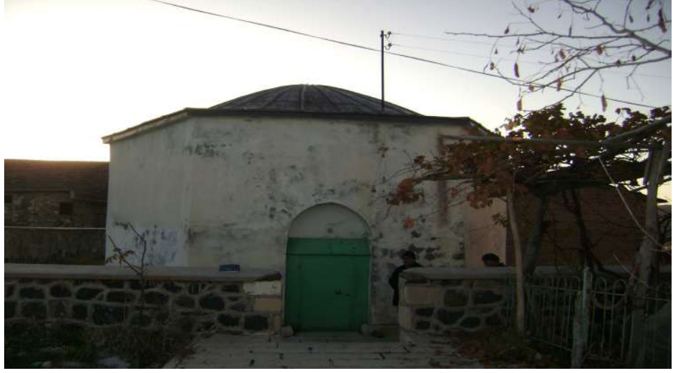
Resim 7: Murat Baba Türbesi dıştan görünüşü