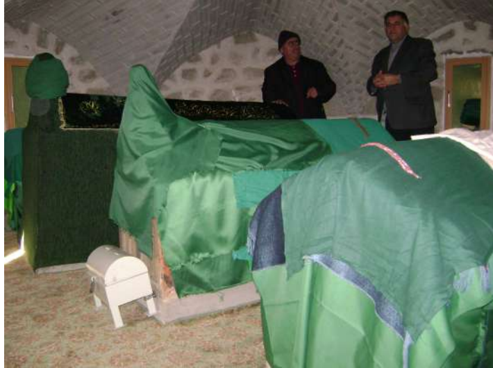
Resim 16: Mansur Baba Türbesi içten görünüm